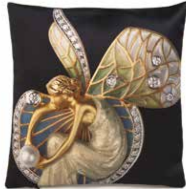
Cojín seda Hada de perfil, Masriera Masriera silk cushion, Fairy profile view Medidas/Measures: 30 x 30 cm Ref.: 781179