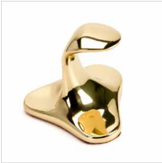
Reproducción fidedigna de un tirador de puerta ergonómico diseñado por Antoni Gaudí para la Casa Milà, conocida como "La Pedrera" ("la cantera"), (Barcelona, 1906-1912). Latón pulido brillante, trabajado artesanalmente en Barcelona Medidas: 4,5 x 5 cm Ref.: 271343