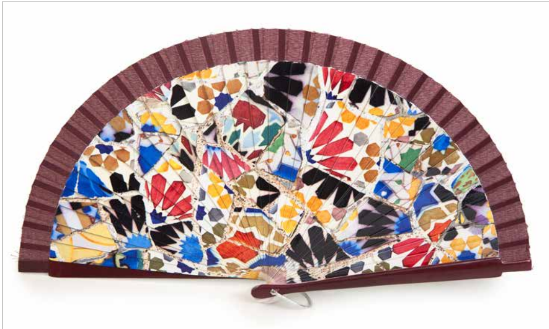
Abanico lacado flor rosa decorado con la imagen de uno de los mosaicos de "trencadís" que decoran el Park Güell de Gaudí. Ref.: 865733