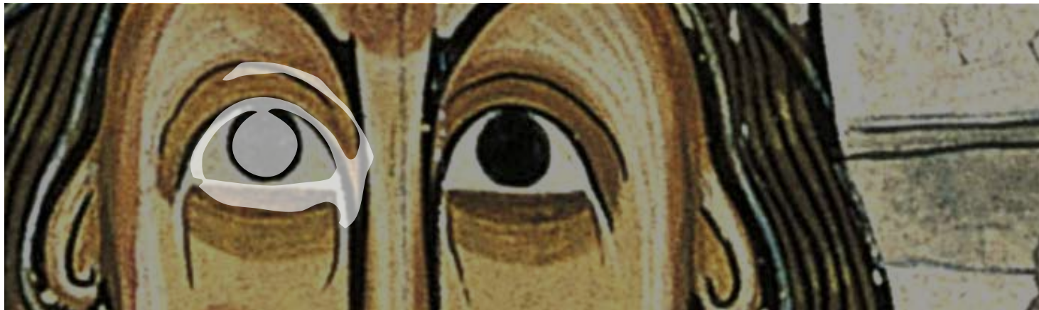
Absis de Sant Climent de Taüll, cap a 1123 (detall)