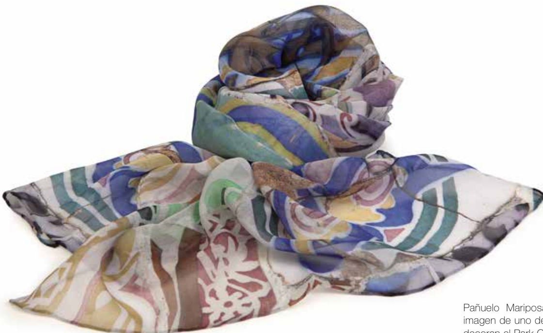
Pañuelo Mariposa 100% seda decorado con la imagen de uno de los mosaicos de "trencadís" que decoran el Park Güell de Gaudí. Ref.: 875254