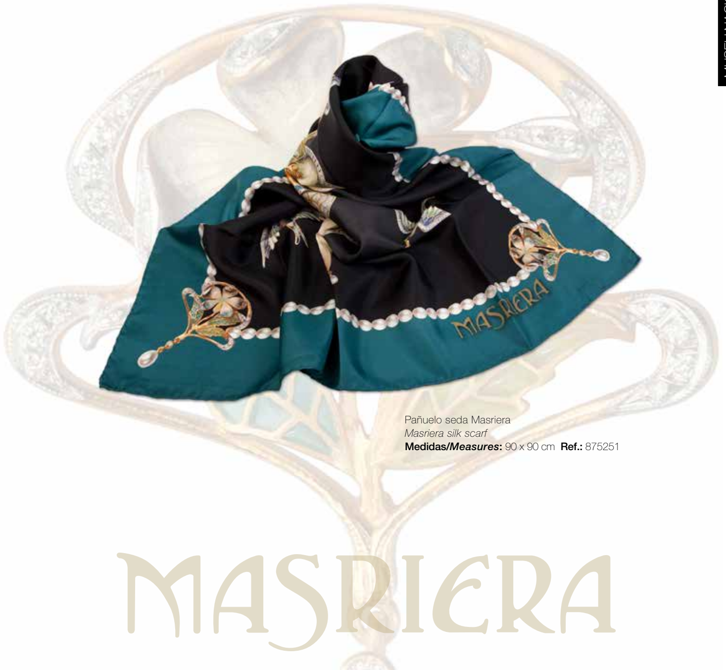
Pañuelo seda Masriera Masriera silk scarf Medidas/Measures: 90 x 90 cm Ref.: 875251