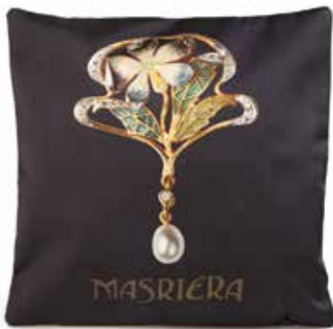
Cojín seda Flor, Masriera Masriera silk cushion, Flower Medidas/Measures: 30 x 30 cm Ref.: 781177