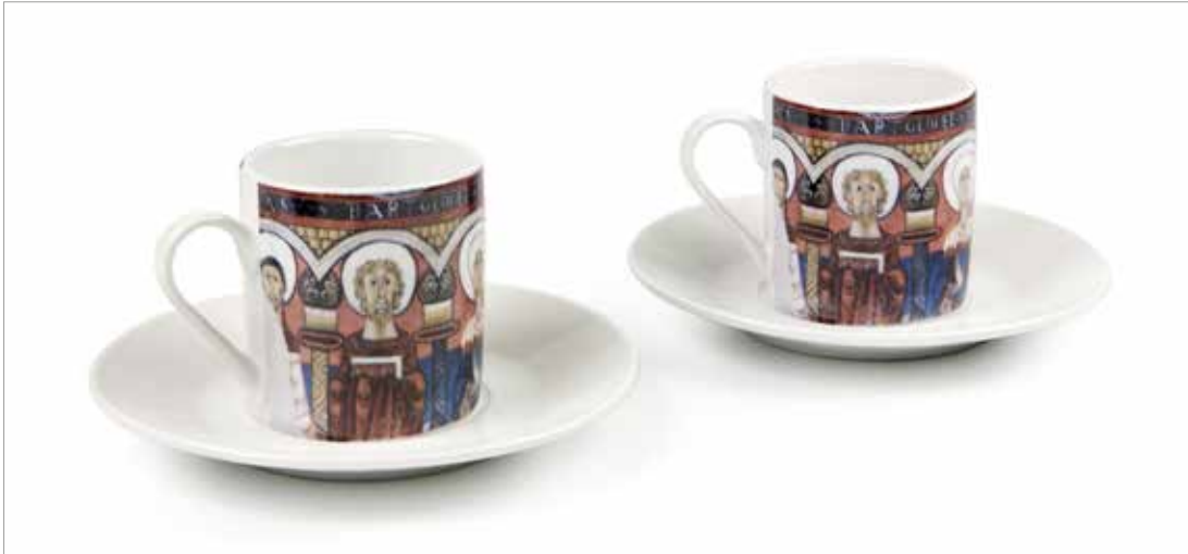
Juego 2 tazas de café inspirado en el ábside central de Sant Climent de Taüll. Vista delantera y trasera. Ref.: 898993