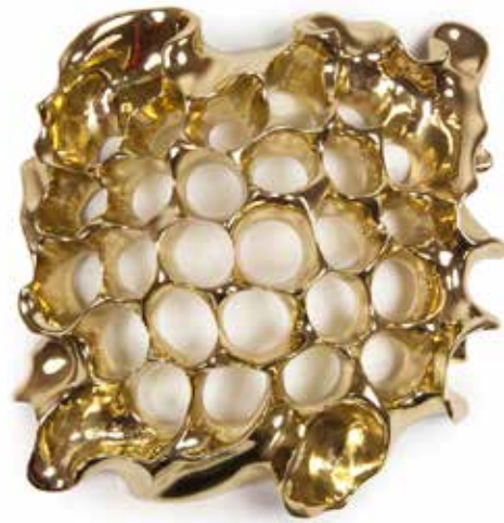
Reproducción de un modelo de mirilla originalmente diseñado por Antoni Gaudí para las puertas de entrada de la Casa Calvet (Barcelona, 1898-1904). Latón pulido brillante trabajado artesanalmente en Barcelona Medidas: 6,8 x 22,6 x 10 cm Ref.: 271405