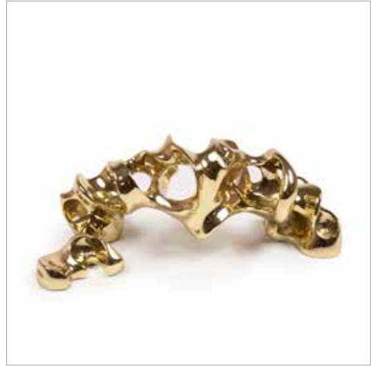
Reproducción de un modelo de tirador de puerta grande diseñado por Antoni Gaudí para las puertas de entrada de los pisos de la Casa Calvet, (Barcelona, 1898-1904). Latón pulido brillante, trabajado artesanalmente en Barcelona Medidas: 6,8 x 22,6 x 10 cm Ref.: 271342