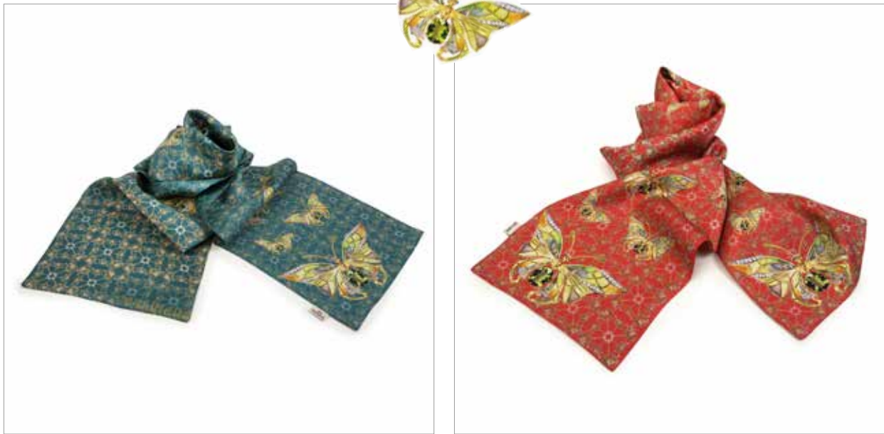
Foulard seda Verde Masriera Green silk Masriera headscarf Medidas/Measures: 180 x 40 cm Ref.: 875249