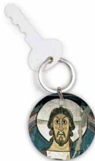
Llavero con detalle del ábside central de Sant Climent de Taüll.