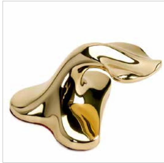
Reproducción fidedigna de un tirador de puerta ergonómico con forma de hoja diseñado por Antoni Gaudí para la Casa Milà, conocida como "La Pedrera" ("la cantera"), (Barcelona, 1906-1912). Latón pulido brillante, trabajado artesanalmente en Barcelona Medidas: 6 x 5,2 x 4,5 cm Ref.: 271339