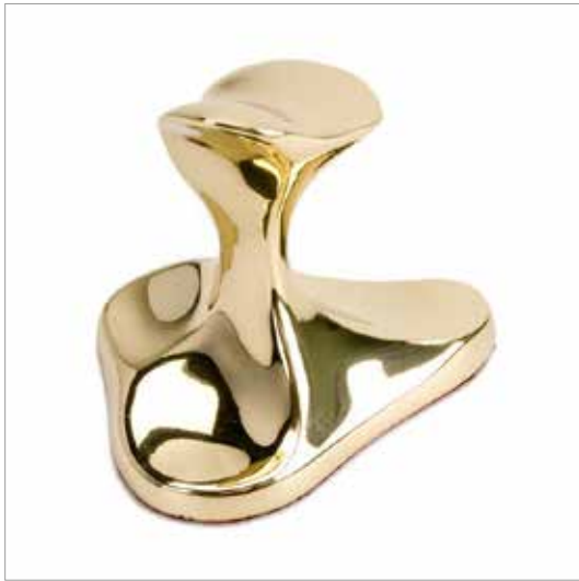
Reproducción fidedigna de un pequeño tirador de puerta ergonómico con forma de corazón diseñado por Antoni Gaudí para la Casa Milà, conocida como "La Pedrera" ("la cantera"), (Barcelona, 1906-1912). Latón pulido brillante, trabajado artesanalmente en Barcelona Medidas: 4,8 x 5 cm Ref.: 271341