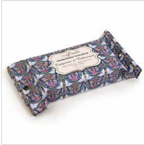
Jabón perfumado Mariposa con la imagen de uno de los mosaicos de "trencadís" que decoran el Park Güell de Gaudí. Medidas: 7,5 cm Ref.: 783580