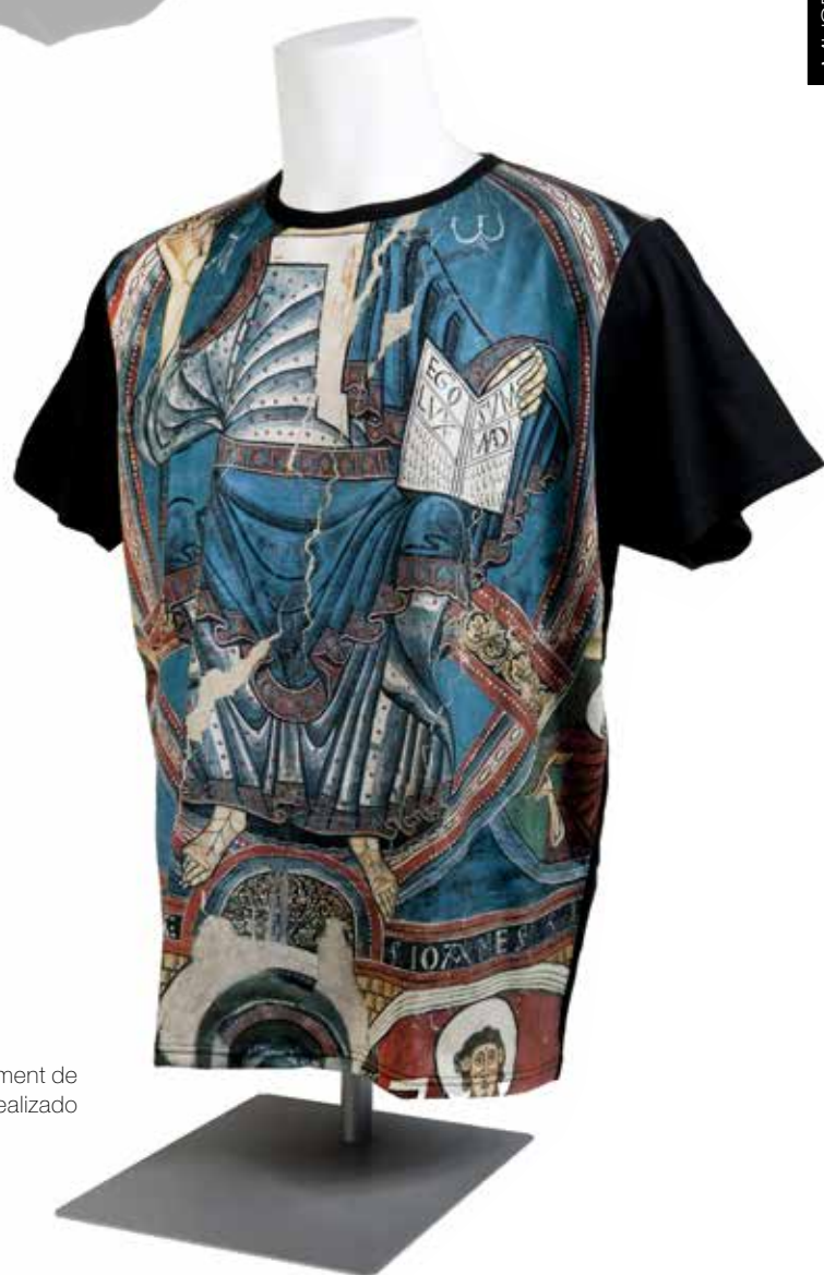
Camiseta full print con ábside central de Sant Climent de Taüll con el "Cristo en majestad o Pantocrator", realizado cerca del 1123.