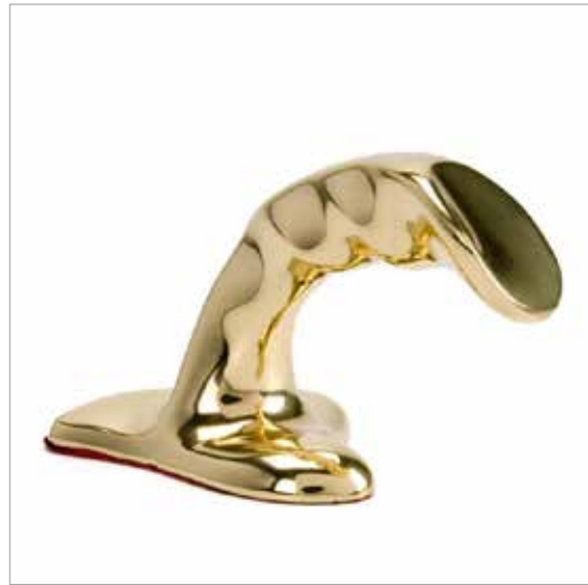
Reproducción fidedigna de un tirador de puerta ergonómico diseñado por Antoni Gaudí para la Casa Milà, conocida como "La Pedrera" ("la cantera"), (Barcelona, 1906-1912). Latón pulido brillante, trabajado artesanalmente en Barcelona Medidas: 7,2 x 5,5 x 6,2 cm Ref.: 271340