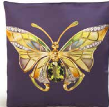
Cojín seda Mariposa, Masriera Masriera silk cushion, Butterfly Medidas/Measures: 30 x 30 cm Ref.: 781175